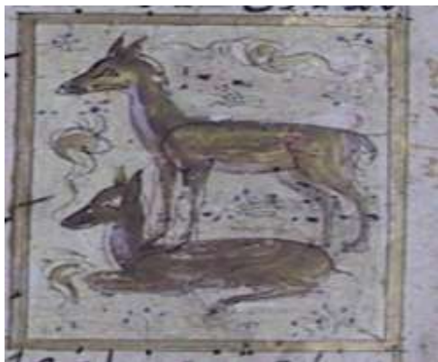
لوحة (۱۲) تصویرة تمثل ظبي ، من مخطوط عجائب المخلوقات و غرائب الموجودات المؤرخ ۸۲۷ هـ / ۱۴۲۳ م ، محفوظ في مكتبة جامع لاله لي بتركيا ، تدرس وتنتشر لأول مرة