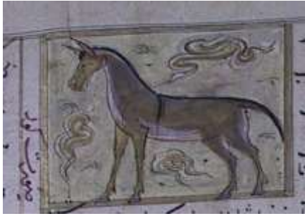
لوحة (۴) تصويرة تمثل الحمار الوحش ، من مخطوط عجائب المخلوقات وغرائب الموجودات ، المؤرخ ۸۲۷ هـ / ۱۴۲۳ م ، محفوظ في مكتبة جامع لاله لي بتركيا ، تدرس وتنتشر لأول مرة