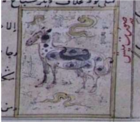
لوحة (۱۰) تصویرة تمثل ضان ، من مخطوط عجائب المخلوقات وغرائب الموجودات ، المؤرخ ۸۲۷هـ / ۱۴۲۳ م ، محفوظ في مكتبة جامع لاله لي بتركيا ، تدرس وتنتشر لأول مرة