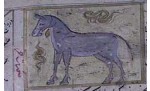
لوحة (۳) تصويرة تمثل الحمار ، من مخطوط عجائب المخلوقات وغرائب الموجودات ، المؤرخ ۸۲۷ هـ / ۱۴۲۳ م ، محفوظ في مكتبة جامع لاله لي بتركيا ، تدرس وتنتشر لأول مرة