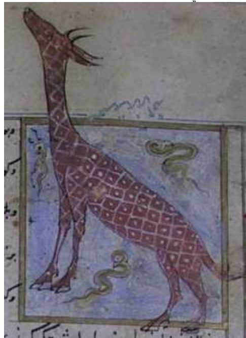
لوحة (۹) تصویرة تمثل زرافة ، من مخطوط عجائب المخلوقات وغرائب الموجودات المؤرخ ۸۲۷هـ / ۱۴۲۳ م ، محفوظ في مكتبة جامع لاله لي بتركيا ، تدرس وتنتشر لأول مرة