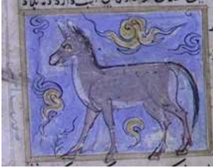
لوحة (۲) تصويرة تمثل البغل ، من مخطوط عجائب المخلوقات وغرائب الموجودات ، مؤرخ ۸۲۷ هـ / ۱۴۲۳ م ، محفوظ في مكتبة جامع لاله لي بتركيا ، تدرس وتنتشر لأول مرة