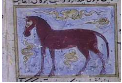
لوحة (۱) تصويرة تمثل الفرس ، من مخطوط عجائب المخلوقات وغرائب الموجودات ، مؤرخ ۸۲۷ هـ / ۱۴۲۳ م ، محفوظ في مكتبة جامع لاله لي بتركيا ، تدرس وتنتشر لأول مرة