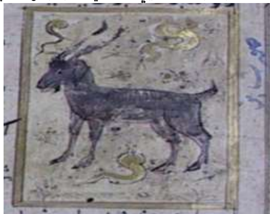
لوحة (۱۱) تصویرة تمثل معز ، من مخطوط عجائب المخلوقات و غرائب الموجودات، المؤرخ ۸۲۷ هـ / ۱۴۲۳ م ، محفوظ في مكتبة جامع لاله لي بتركيا ، تدرس وتنتشر لأول مرة