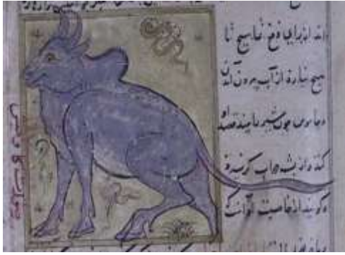
لوحة (۸) تصویرة تمثل جاموس ، من مخطوط عجائب المخلوقات وغرائب الموجودات ، المؤرخ ۸۲۷هـ / ۱۴۲۳ م ، محفوظ في مكتبة جامع لاله لي بتركيا ، تدرس وتنتشر لأول مرة