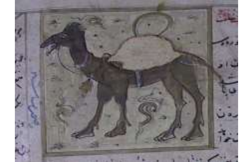
لوحة (۵) تصويرة تمثل الأبل ، من مخطوط عجائب المخلوقات وغرائب الموجودات المؤرخ ۸۲۷ هـ / ۱۴۲۳ م ، محفوظ في مكتبة جامع لاله لي بتركيا ، تدرس وتنتشر لأول مرة