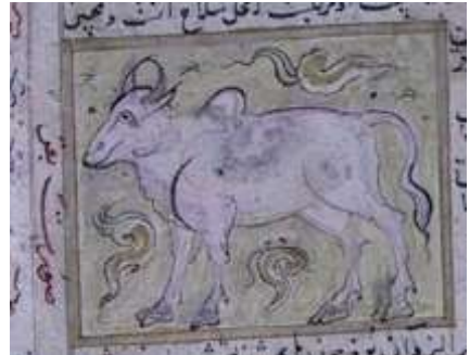
لوحة (۶) تصويرة تمثل بقر ، من مخطوط عجائب المخلوقات وغرائب الموجودات المؤرخ ۸۲۷ هـ / ۱۴۲۳ م ، محفوظ في مكتبة جامع لاله لي بتركيا ، تدرس وتنتشر لأول مرة