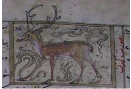
لوحة (۷) تصویرة تمثل بقر الوحش ، من مخطوط عجائب المخلوقات وغرائب الموجودات المؤرخ ۸۲۷هـ / ۱۴۲۳ م ، محفوظ في مكتبة جامع لاله لي بتركيا ، تدرس وتنتشر لأول مرة