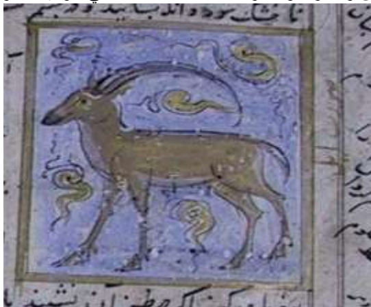
لوحة (۱۳) تصویرة تمثل ايل ، من مخطوط عجائب المخلوقات و غرائب الموجودات المؤرخ ۸۲۷ هـ / ۱۴۲۳ م ، محفوظ في مكتبة جامع لاله لي بتركيا ، تدرس وتنتشر لأول مرة